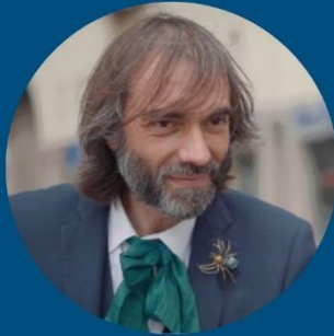
Invité : Cédric VILLANI Mathématicien